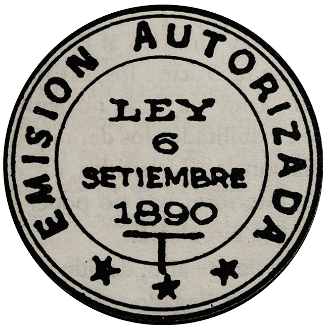
FOTO 2. Resello.