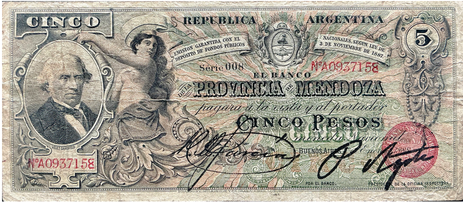
FOTO 13. 5 Pesos sin resello Provincia de Mendoza

con el rubro por 5.000.000 de pesos, parte de los cuales –por la necesidad de circulante– fueron emitidos con resellos posteriormente, y pidieron otros 5 millones con la leyenda correcta: “Banco de la Provincia de Mendoza”.