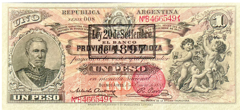
FOTO 6. 1 Peso resello 1897.

Se emitieron 95.000 en 1888, pero en las memorias de la Caja de Conversión de 1895 (7) , dentro del ítem “Emisión habilitada sin emitir quemada”, figura exactamente esa cantidad. Suponemos, sin haber podido aún ubicar documentación, que luego de emitir esa cantidad parcial notaron el error y dejaron de habilitarlos.