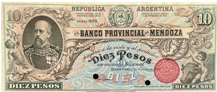
FOTO 11. Muestra 10 Pesos.