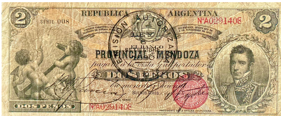
FOTO 3. 2 pesos con resello 1890.

En el decreto anterior, encontramos una mención expresa referida a los billetes del rubro “Banco Provincial de Mendoza”, los cuales, excepto el valor de 1 peso al cual nos referiremos más adelante, fueron habilitados en las siguientes cantidades: 2$, 84.000 billetes, $168.000.