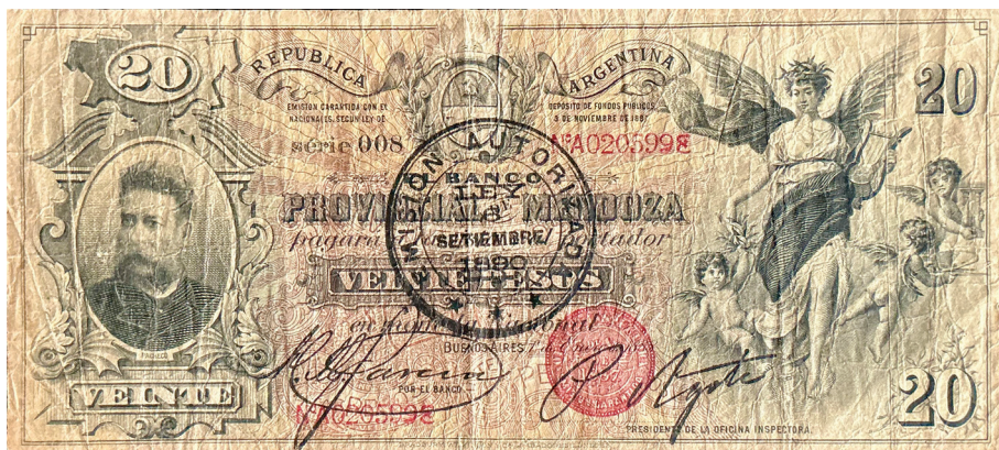
FOTO 1. 20 pesos con resello 1890.

Dentro de la serie de billetes de Bancos Nacionales Garantidos existe un curioso error, motivo de largos debates durante décadas. Esperamos poder resolver las dudas a través de esta investigación, gracias a la cantidad de piezas y documentos que hemos podido examinar. El error consiste en la leyenda “Banco Provincial de Mendoza” en lugar de la correcta “Banco de la Provincia de Mendoza”.