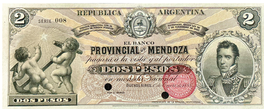
FOTO 9. Muestra 2 pesos.