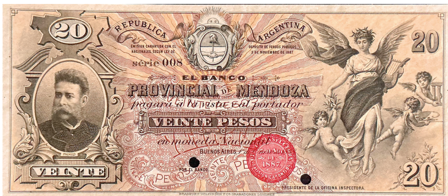
FOTO 12. Muestra 20 Pesos.