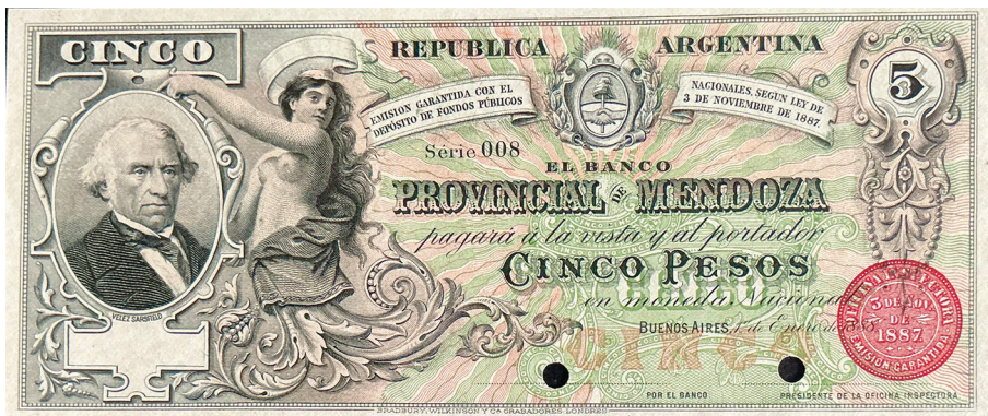
FOTO 10. Muestra 5 pesos.