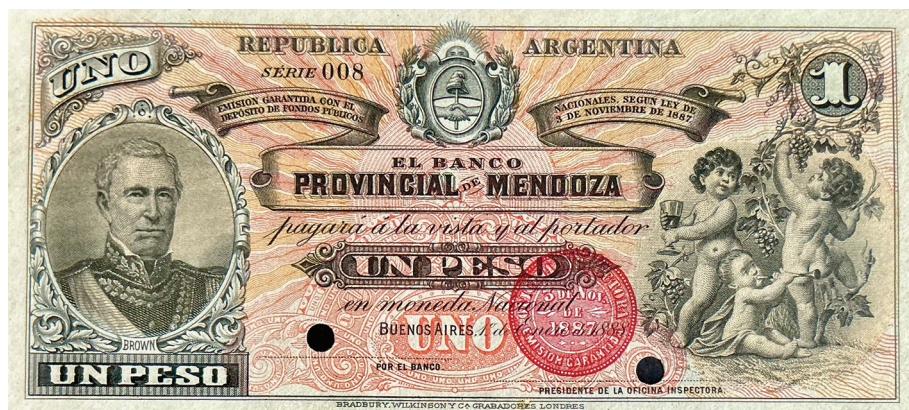
FOTO 8. Muestra 1 peso.

En el libro original con muestras de billetes de cada una de las sucursales, constatamos que estaban solo con el rubro “Banco provincial de Mendoza”.