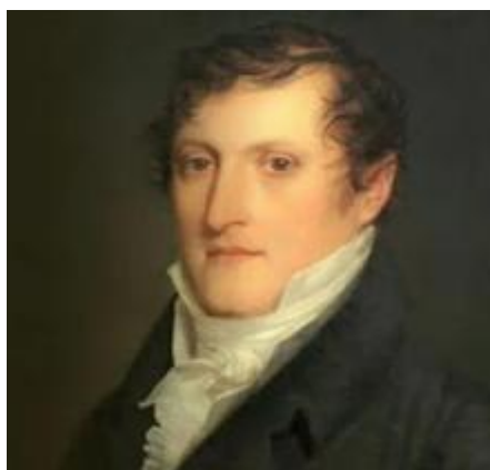
General Manuel Belgrano.

Manuel Belgrano. El creador de la bandera argentina, uno de los patriotas que impulsaron la Revolución de Mayo y uno de los máximos héroes de la Guerra de Independencia.