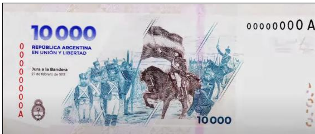
Anverso y reverso del nuevo billete de $10.000 emitido por el BCRA.