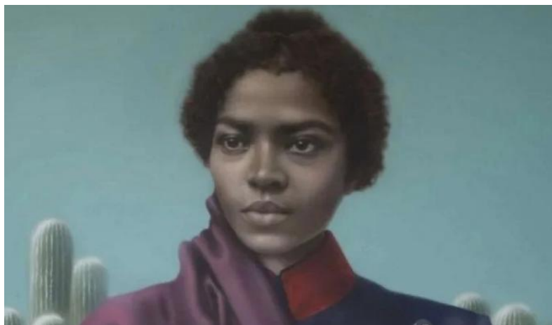
María Remedios del Valle, también conocida como la Capitana de la Patria.

María Remedios del Valle. Heroína. Como mujer y afrodescendiente, debió enfrentar todos los prejuicios y limitaciones de la época.