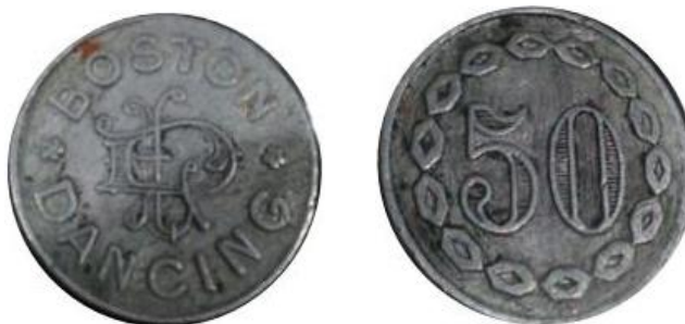
Ficha acuñada en aluminio por la casa Barés.