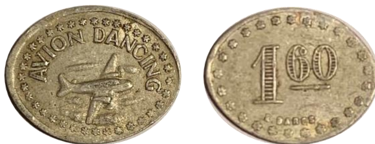
Ficha acuñada por Enrique Barés.