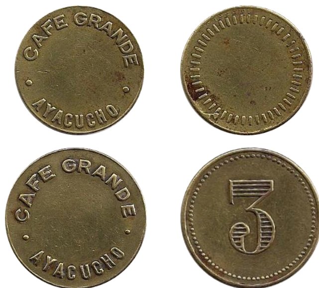
Fichas acuñadas en bronce por Enrique Barés. (*)