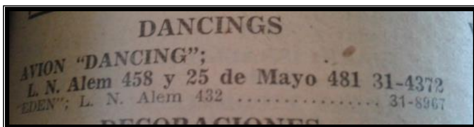
Guía de Correos y Telégrafos – Publicación Oficial - 1938 / 1939