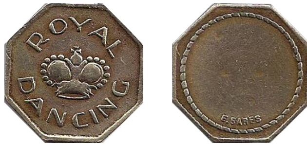
Ficha octogonal acuñada en bronce por Enrique Barés, una de las últimas piezas producidas por la firma.