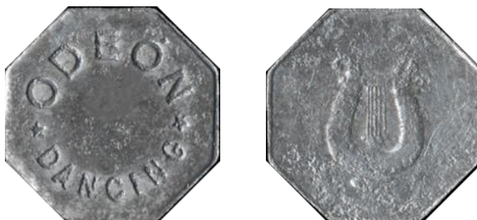
Ficha acuñada en aluminio por Enrique Barés.