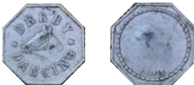
Ficha octogonal acuñada en aluminio por Enrique Barés.