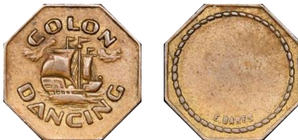
Ficha acuñada en bronce por Enrique Barés.