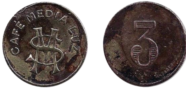
Ficha acuñada en bronce por Enrique Barés.

Otros casos interesantes de piezas con la palabra “Café” en sus anversos que pertenecieron a prostíbulos. La novedad es que a través de una muy importante investigadora del tema pudo descubrir que el numeral ‘3’ en el reverso significaba el valor más alto de los servicios de las prostitutas, es decir el de tres pesos. Seguramente en el caso del “Café Media Luz” también exista otra ficha de menor tamaño como la tarifa más baja de la actividad como vemos en las piezas mostradas a continuación sobre el “Café Grande” de la ciudad de Ayacucho (Pcia. Buenos Aires).