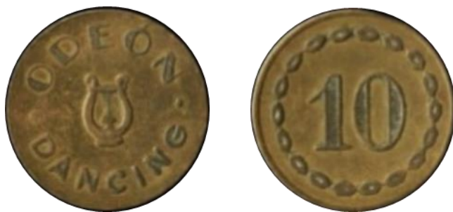
Ficha acuñada en bronce por Enrique Barés.