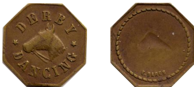
Ficha octogonal acuñada en bronce por Enrique Barés.